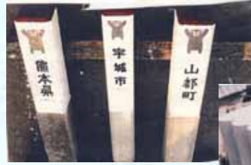
宇城市様より用地境界杭の指定を戴きました。 (従来品より約 9kg 軽)