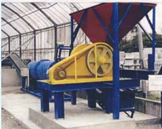
当社開発のエッジレス加工機（3t）

使用する廃棄物の骨材は、角取り・面取りのエッジレス加工を行う実用新案取得（第 3165514 号）によって処理され、（一財）熊本県建設技術センターのコンクリート試験にも合格を頂いておりますので、通常の二次製品と同様に利用することが可能です。